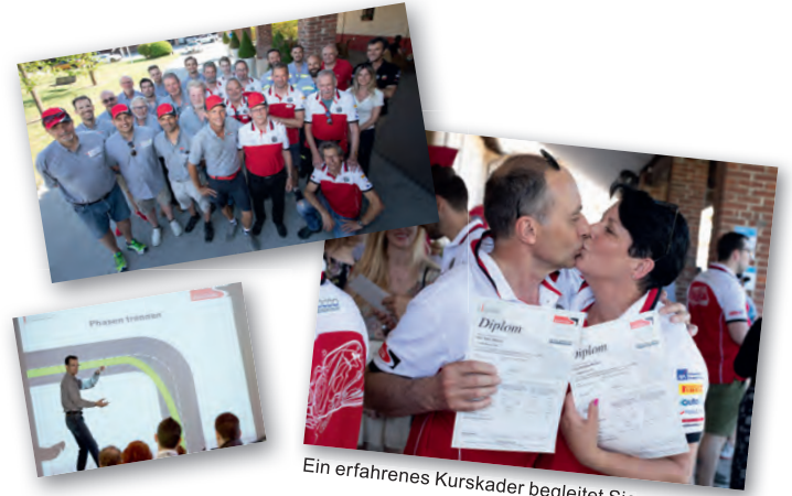
Ein erfahrener Kurskader begleitet Sie

Die Gruppen mit rund 16 Teilnehmern werden von zwei erfahrenen Instruktor:innen in kameradschaftlicher Atmosphäre, ohne Stress und Schulmeisteri, geführt.