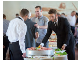
Bestes Piemontesisches Ambiente von A-Z.