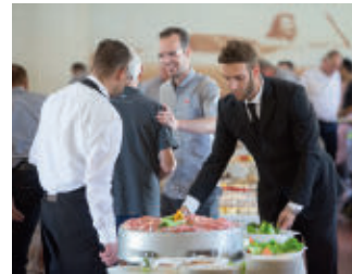
Bestes Piemontesisches Ambiente von A-Z.