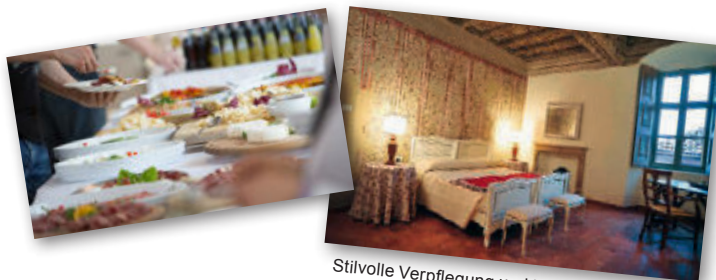
Stilvolle Verpflegung und Unterkunft sind in Balocco garantiert.

In der Umgebung des Ausbildungsgeländes gibt es Hotels verschiedener Preisklassen. Auf professionaldriving.ch finden Sie unsere Hotelempfehlungen. Die Kursteilnehmenden sind gebeten, die Reservation ihren Wünschen entsprechend direkt vorzunehmen.