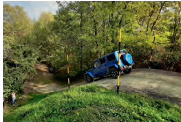
Das Auto gefahrlos im Grenzbereich bewegen.