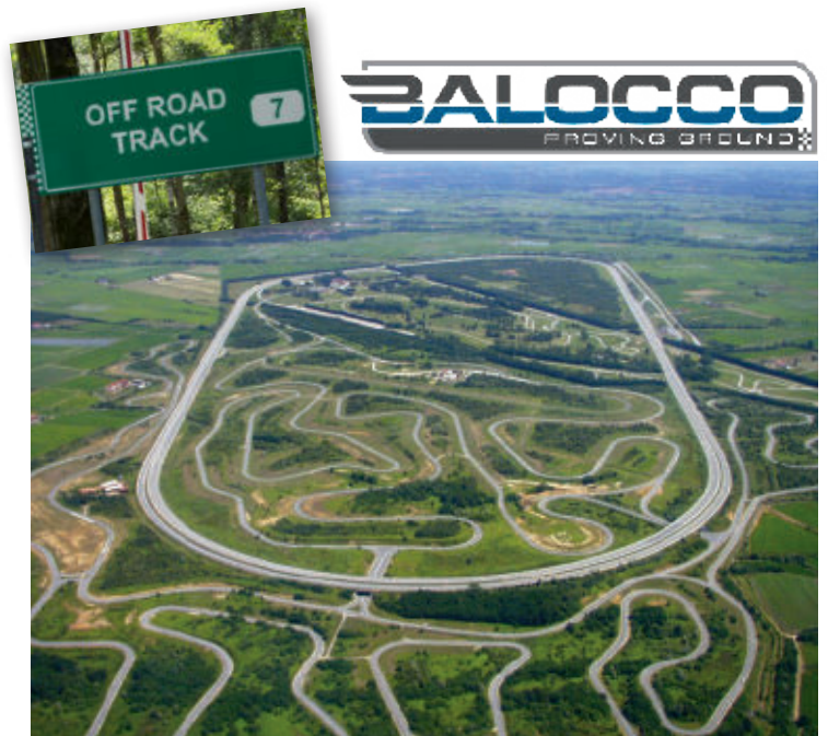
Balocco Proving Ground zwischen Mailand und Turin – eines der grössten Testgelände der Welt.

Seit 2013 organisiert Professional Driving Lehrgänge in Italien. Die Partnerschaft des Balocco Proving Ground und der Professional Driving AG ist einmalig und garantiert dem Teilnehmer ein unvergessliches Erlebnis auf dem sonst hermetisch von der Öffentlichkeit abgeschotteten Gelände.