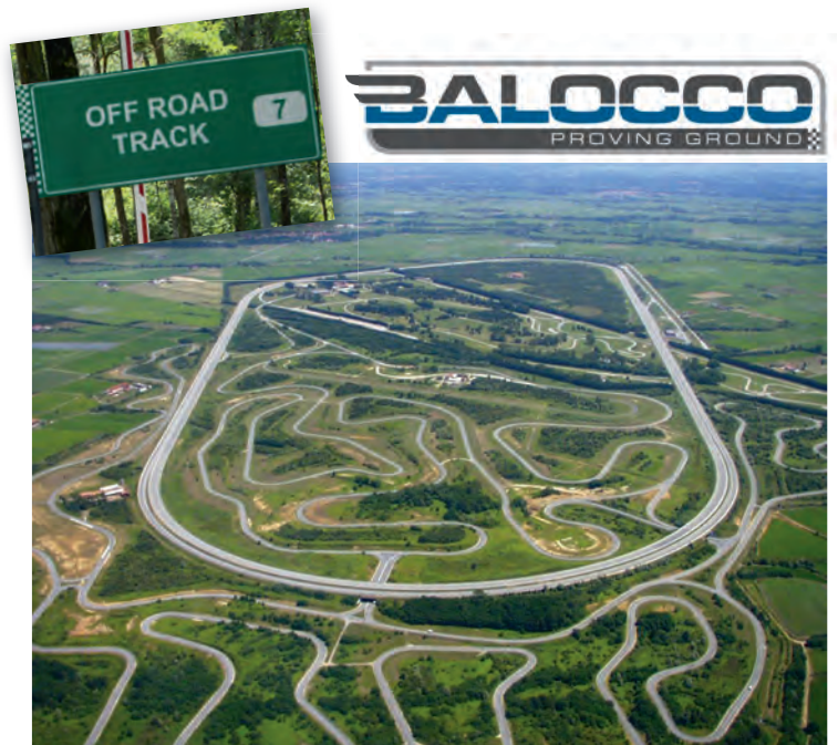
Balocco Proving Ground zwischen Mailand und Turin – eines der grössten Testgelände der Welt.

Seit 2013 organisiert Professional Driving Lehrgänge in Italien. Die Partnerschaft des Balocco Proving Ground und der Professional Driving AG ist einmalig und garantiert dem Teilnehmer ein unvergessliches Erlebnis auf dem sonst hermetisch von der Öffentlichkeit abgeschotteten Gelände.