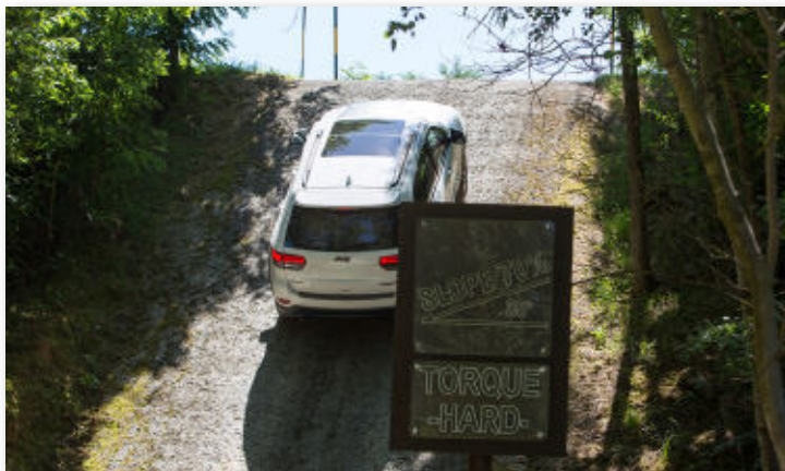
Erleben, was das Auto kann.

Das Programm ist intensiv und hat einen logischen Aufbau. Der Schwerpunkt liegt auf praktischen Fahrübungen, unterstützt durch gehaltvolle Theorien, Mitfahrgelegenheiten bei InstruktorInnen, Gruppen- und persönliche Gespräche. Die Fahrzeugbeherrschung in jeder Situation und das frühzeitige Erkennen von Gefahren sind das Ziel – selbstverständlich in Kombination mit sehr viel Fahrspass.