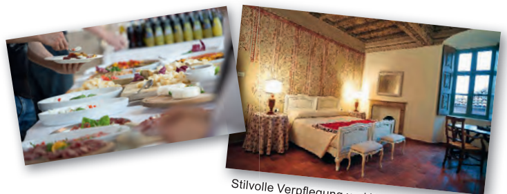
Stilvolle Verpflegung und Unterkunft sind in Balocco garantiert.

In der Umgebung des Ausbildungsgeländes gibt es Hotels verschiedener Preisklassen. Die Teilnehmenden können die Zimmerbuchung direkt über uns oder selbständig tätigen.