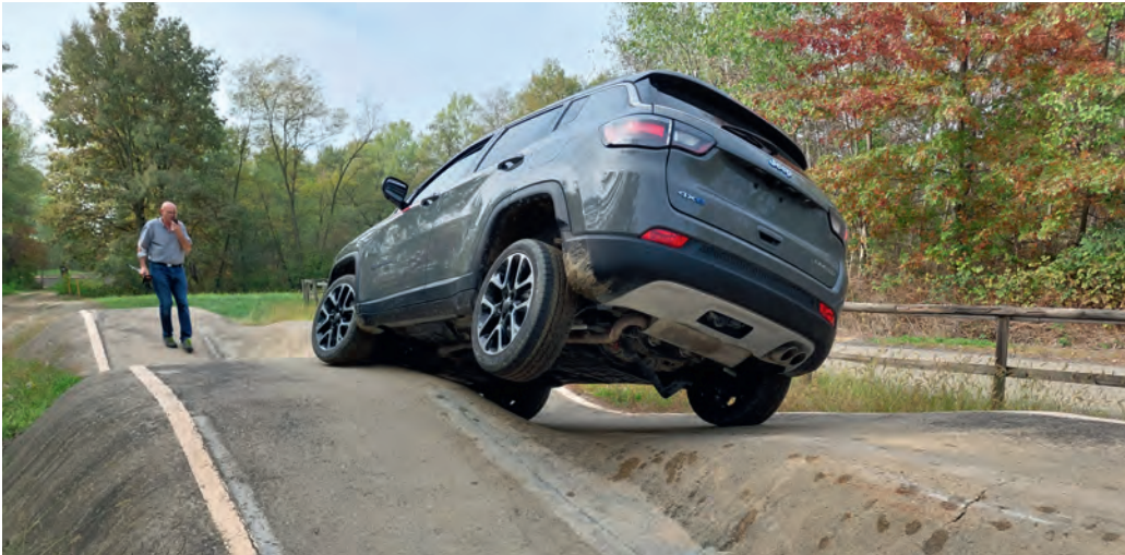
Ihr Auto dort erleben, wo es entwickelt wurde.