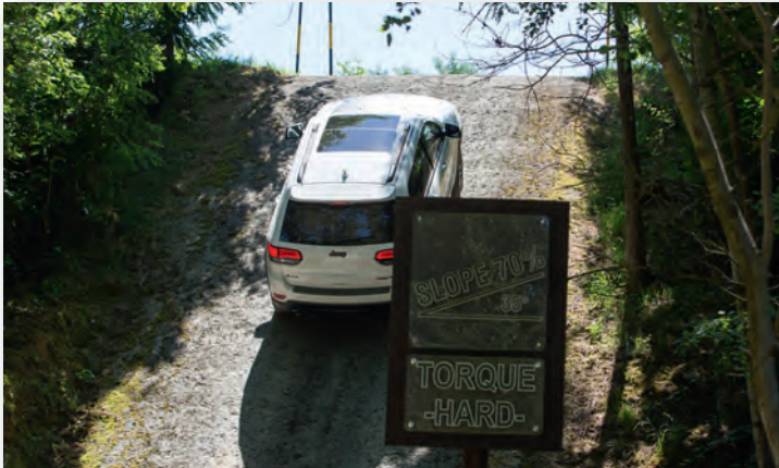
Erleben, was das Auto kann.

Das Programm ist intensiv und hat einen logischen Aufbau. Der Schwerpunkt liegt auf praktischen Fahrübungen, unterstützt durch gehaltvolle Theorien, Mitfahrgelegenheiten bei Instruktor:innen, Gruppen- und persönliche Gespräche. Die Fahrzeugbeherrschung in jeder Situation und das frühzeitige Erkennen von Gefahren sind das Ziel – selbstverständlich in Kombination mit sehr viel Fahrspass.