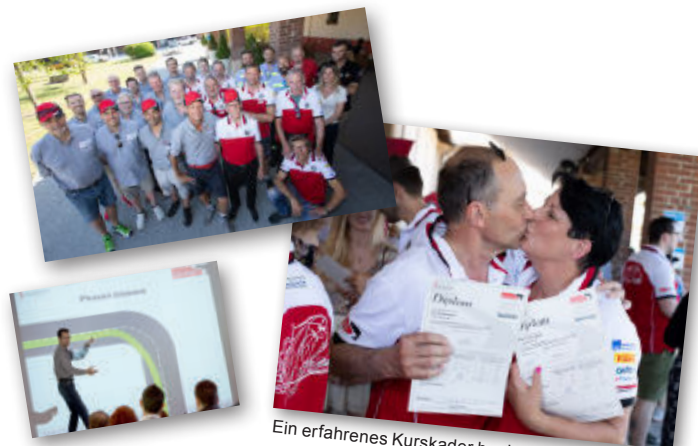
Ein erfahrener Kurskader begleitet Sie

Die Gruppen mit rund 16 Teilnehmern werden von zwei erfahrenen InstruktorInnen in kameradschaftlicher Atmosphäre, ohne Stress und Schulmeisteri, geführt.