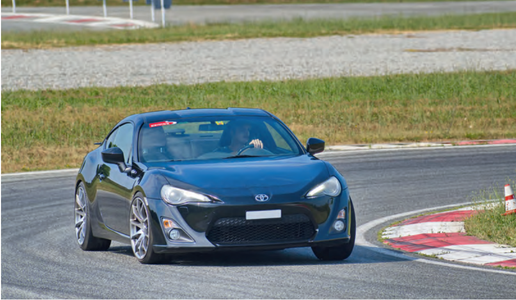
Top Infrastruktur mit Übungsstrecken in allen Varianten und mit viel Auslaufzone garantiert Lernerfolg und maximalen Fahrspass.