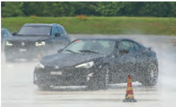
Viel Fahrspass unter fachkundiger Anleitung.