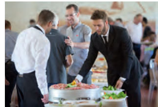
Bestes Piemontesisches Ambiente von A-Z.