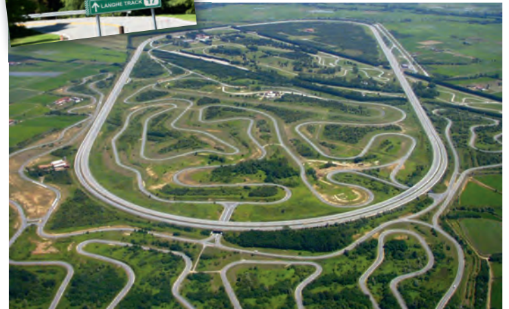
Balocco Proving Ground zwischen Mailand und Turin – eines der grössten Testgelände der Welt.