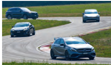
Das Auto gefahrlos im Grenzbereich bewegen.