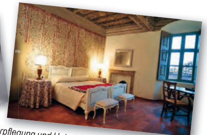
Stilvolle Verpflegung und Unterkunft sind in Balocco garantiert.