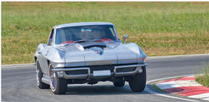
Sicheres Training ohne Randsteine und Leitplanken.

Das Programm ist intensiv und hat einen logischen Aufbau. Der Schwerpunkt liegt auf 13 praktischen Fahrübungen, unterstützt durch gehaltvolle Theorien, Mitfahrgelegenheiten bei Instruktoren, Gruppen- und persönliche Gespräche. Die Fahrzeugbeherrschung in jeder Situation und das frühzeitige Erkennen von Gefahren sind das Ziel – selbstverständlich in Kombination mit sehr viel Fahrspass.