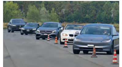
Jeder Teilnehmer legt über 300 Kilometer zurück.